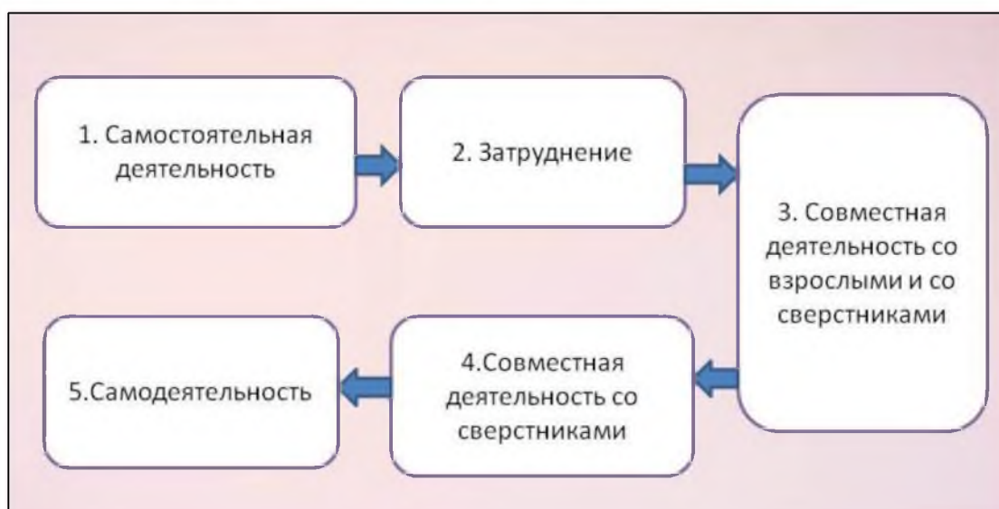
Схема развития любого вида деятельности у детей

* Дыбина О. В. Интеграция образовательных областей в педагогическом процессе ДОУ. М.: Мозаика-Синтез, 2012. С.12-23.