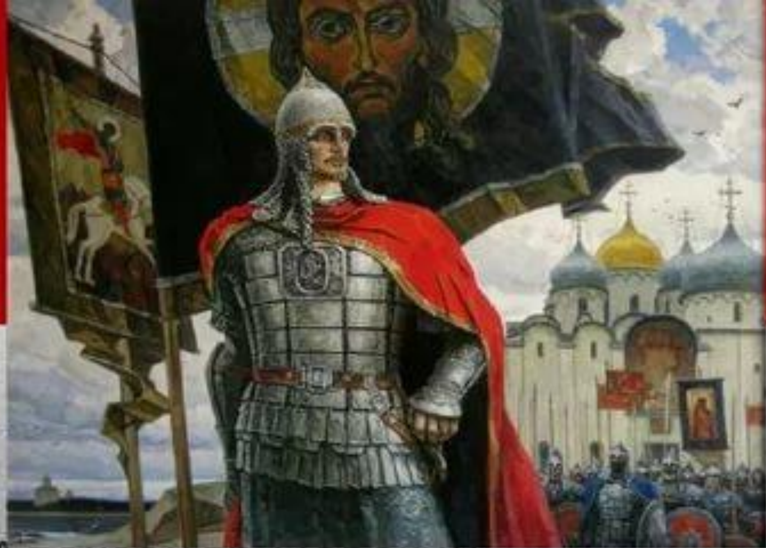
Александр Невский (30 мая 1220 – 14 ноября 1263 гг.)